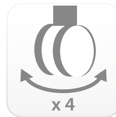
4 ruedas direccionales 2 ruedas con freno