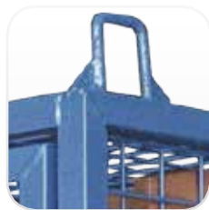
Elemento de enganche para grúa reforzados (opcional)