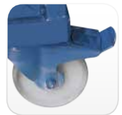
Ruedas de nylon de alta resistencia