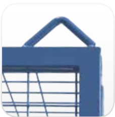
Elementos de enganche para carga con grúa