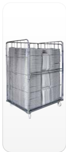
Sillas plegadas en carro FLEXY