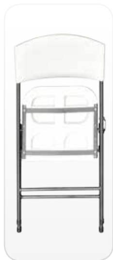
Visión delantera de la silla MIT plegada

Ensayos de seguridad y estabilidad realizados por Aidima