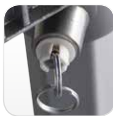
Cierre con dos posiciones: Bloqueado / desbloqueado