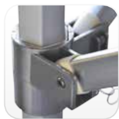
Articulaciones de aluminio de fundición