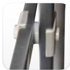
Separador de barras: reducción de desgaste de la cubierta