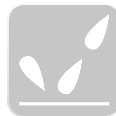
Cubierta impermeable: Acabado película PVC