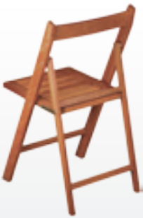
Silla CLASSIC parte trasera