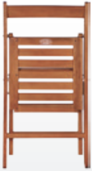
Silla CLASSIC plegada