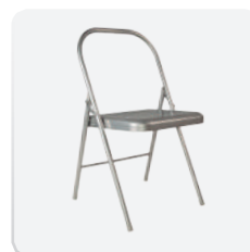
Versión Yoga (CP008YG)