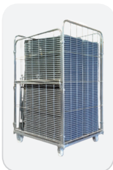
Sillas plegadas en carro modelo FLEXY