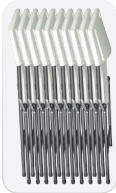
Sillas plegadas y apiladas