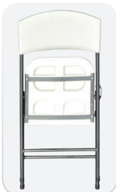
Visión delantera de la silla MIT plegada