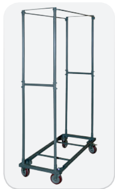
Carro modelo Vertex : Capacidad de 60 sillas modelo INTENSIVE