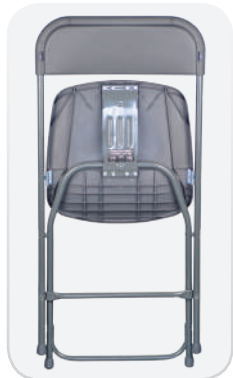
Visión trasera de la silla INTENSIVE plegada