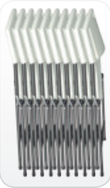
Sillas plegadas y apiladas