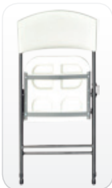
Visión delantera de la silla MIT plegada