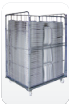
Sillas plegadas en carro modelo FLEXY