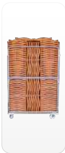
Sillas plegadas en carro FLEXY