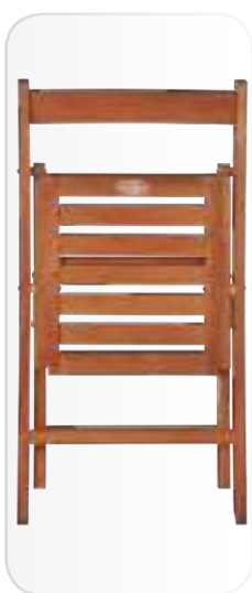
Silla CLASSIC plegada