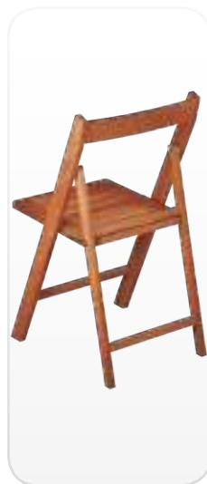
Visión trasera de la silla CLASSIC abierta

Ensayos de seguridad y estabilidad realizados por Aidima