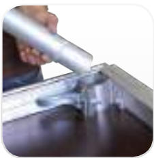
Desbloquee el sistema de anclaje