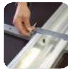
Mantenga los módulos unidos con mordazas