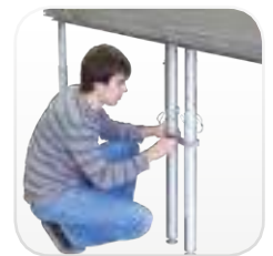
Fortalezca la estructura manteniendo los pies unidos