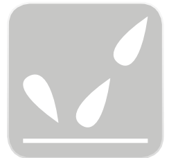
Cubierta impermeable: Acabado película PVC