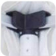
Articulaciones plásticas de alta resistencia