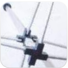
Sistema de reducción de rozamientos en articulaciones del techo