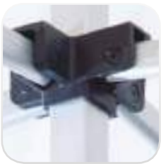
Cantos y articulaciones con acabados de protección redondeados