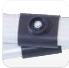
Separador de barras: reducción de desgaste de la cubierta