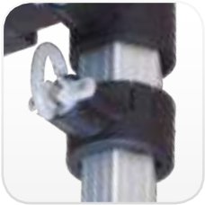
Sistema de reducción de rozamientos en articulaciones deslizantes de los pies