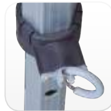
Cierre con dos posiciones: Bloqueado / desbloqueado